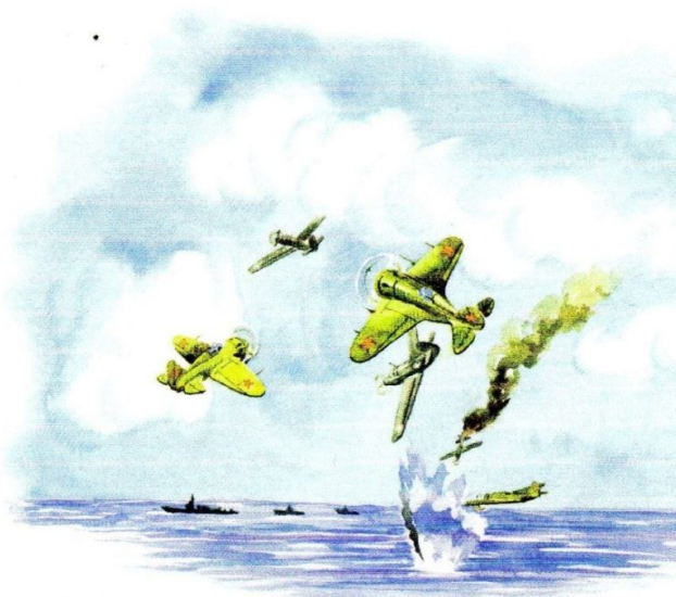
Иллюстрация худ. С. Абариной к книге И. Ядринцевой «О городе Полярном, о флоте легендарном»