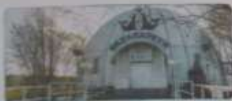
Стадион «Динамо» — один из крупнейших стадионов города. Здесь проводятся различные спортивные мероприятия.