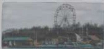
Парк имени Героев — любимое место отдыха жителей города. Здесь можно увидеть знаменитую Ferris wheel.