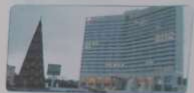
Здание администрации города Мурманска — одна из самых высоких зданий в Мурманске.