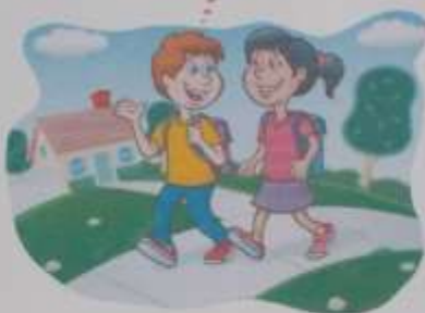
Мурманск — дружный город.