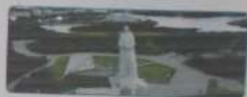
Памятник «Мурманск» — символ дружбы и единения жителей города. Он посвящен героям Великой Отечественной войны.